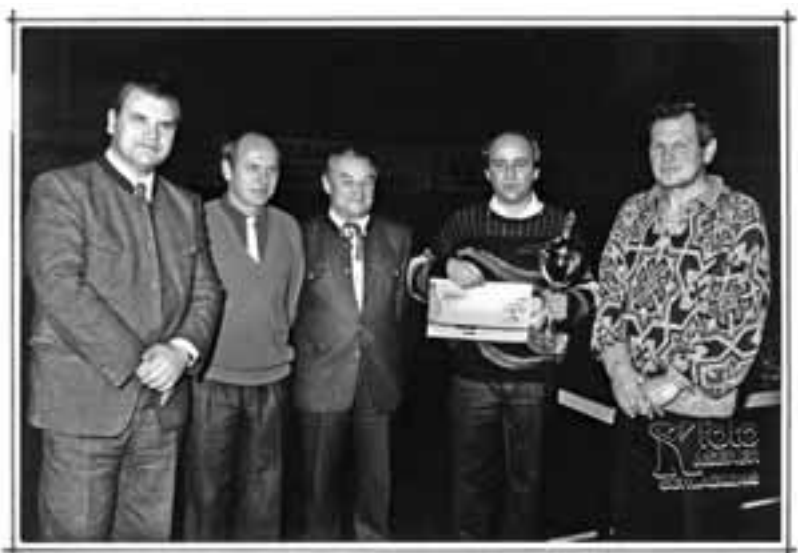
TURNIERSIEGER GASTHOF BRÜGGLER RADSTADT