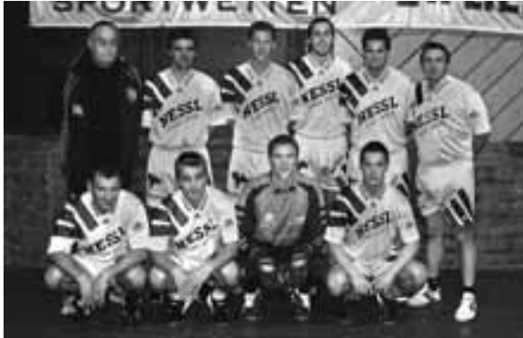
1. Spital an der Drau