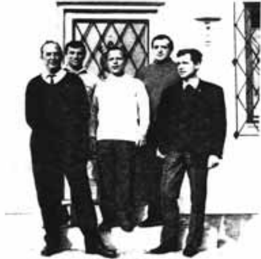
DER VORSTAND DES FC SCHLADMING