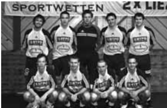
3. Schafalm Planai