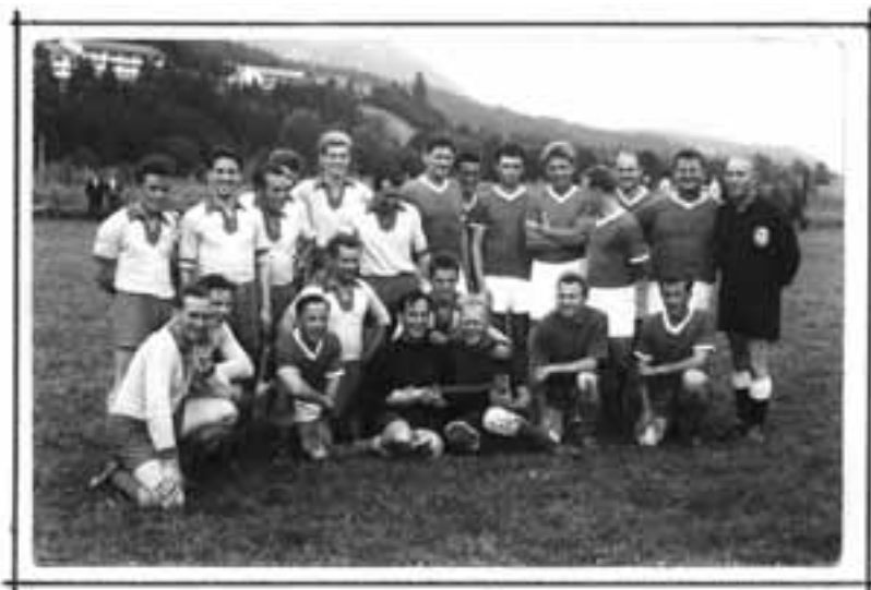
DIE MANNSCHAFTEN DER MUSIKKAPELLE UND DES WINTERSPORTVEREINES MESSEN SICH AUF DEM GRÜNEN RASEN 1967