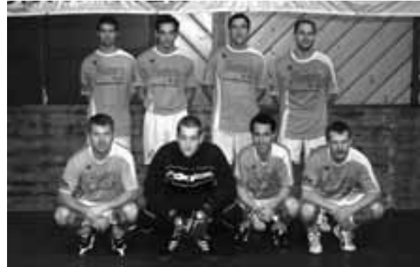
2. Szenario Schladming